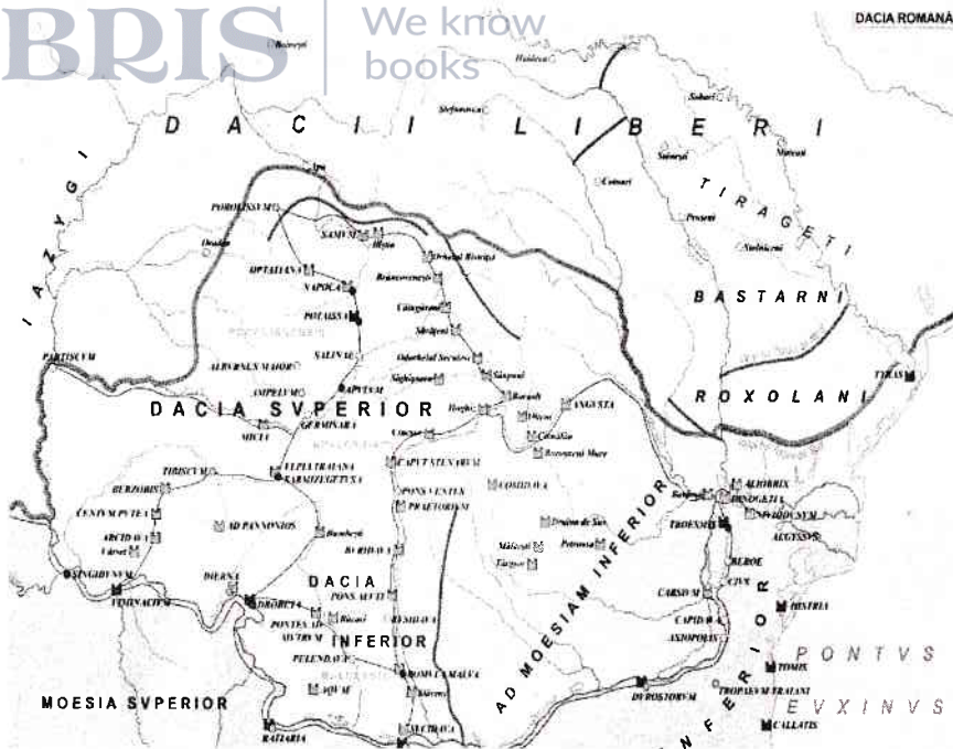
Fig. 2 Harta Daciei

Reconstituirea istoriei unei țări, a monografiilor unor localități, se realizează începând cu așezarea geografică, formele de relief, apele, flora, fauna, apoi se face o analiză teritorială a fenomenelor istorice prin hărți 5 , așa cum s-a menționat mai sus.